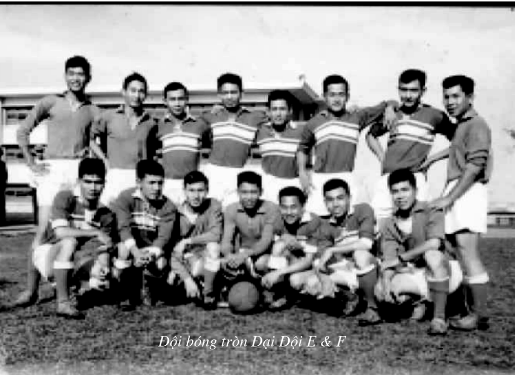
Đội bóng tròn Đại Đội E & F