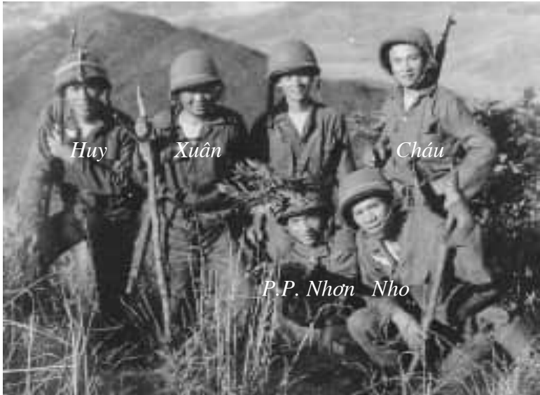
Thực tập Trung Đội Vượt sông tấn công tại Suối Vàng