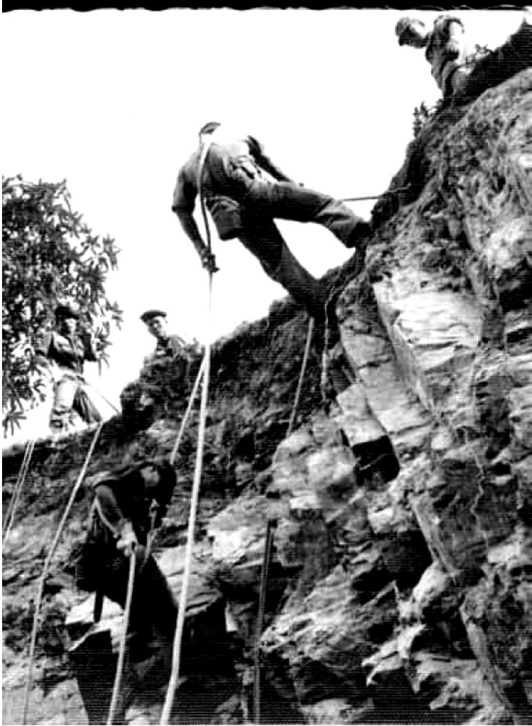
Thực tập tuột núi tại Trung Tâm Huấn Luyện BDQ/ Dục Mỹ. Tai nạn thảm khốc xảy ra tại Trung Tâm huấn luyện này đã làm cho 6 SVSQ K19 tử nạn.