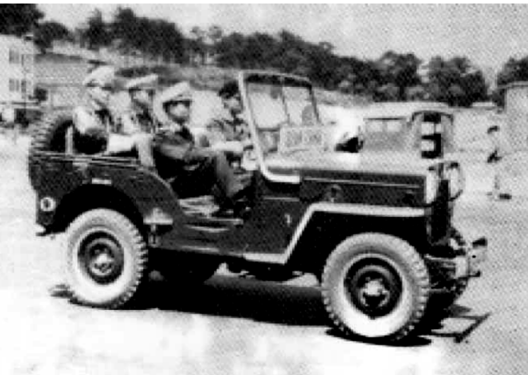
Xe Tuần Tiểu