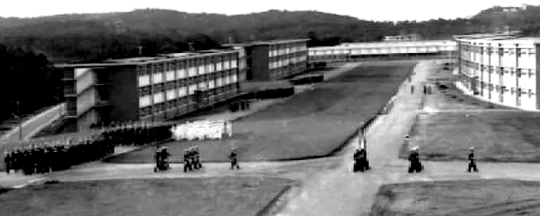
Liên Đoàn SVSQ trên đường di chuyển từ doanh trại ra Vũ Đình Trường Lê Lợi