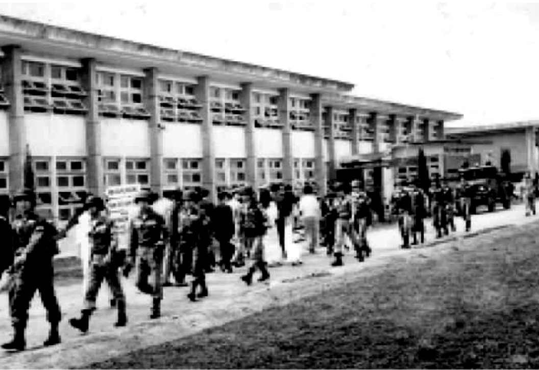
Phái đoàn Tham viếng