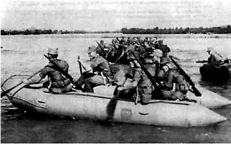
Tấn Công Vượt Sông tại Suối Vàng