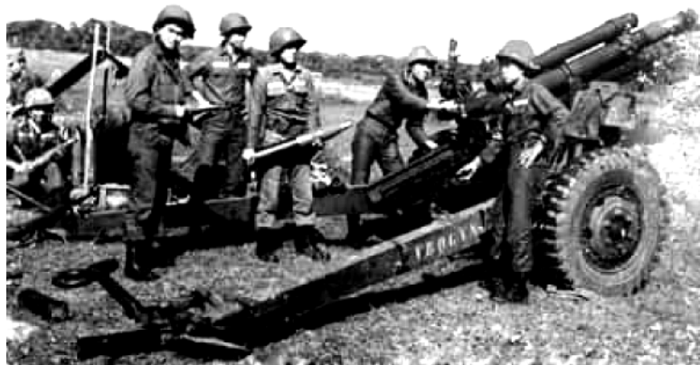
Thực tập Pháo Binh tại M'Lon 1964