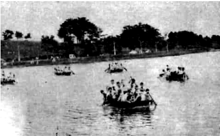
Bơi thuyền trên Hồ Xuân Hương