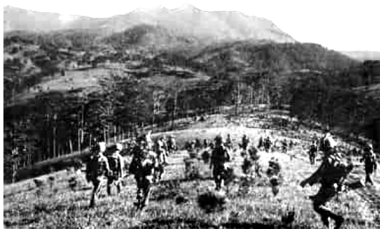
Tấn Công Lapbe Sud