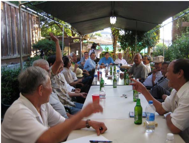
Bầu Đại diện khóa nhiệm kỳ 2008-2010